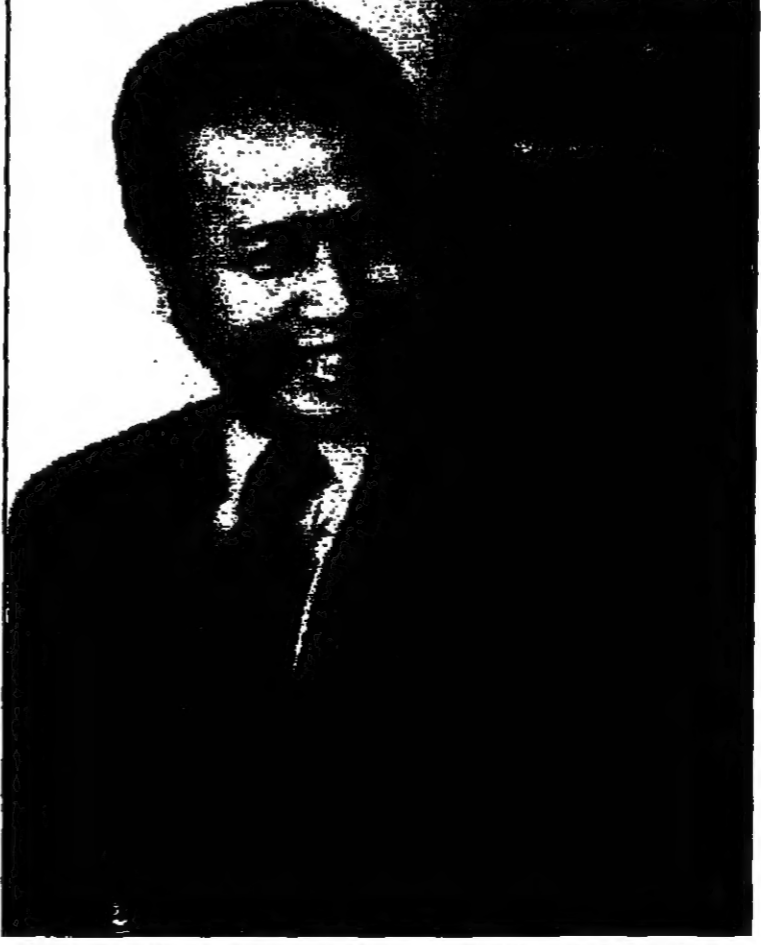
رئيس الوزراء الامير راناريدو في كمبوديا

قيل في بيان صادر عن الخيمير الأحمر، انهم يتمسكون بالامير راناريدو رئيسا اول للوزراء في كمبوديا. وتعد هذه العملية من العمليات السياسية الهامة التي تنفذها الخيمير الأحمر، مما يعزز نفوذهم في البلاد.